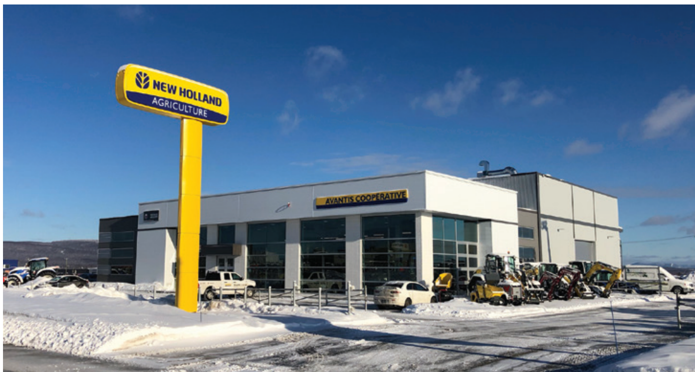
Nouveau centre de machinerie à Saint-Augustin-de-Desmaures

Après plus de deux ans d'existence et forte d'une solide fondation, Avantis est maintenant prête à peaufiner sa réflexion sur ses axes de développement. Un exercice de planification stratégique sera donc entrepris prochainement, pour l'ensemble de l'organisation, et auquel les ambassadeurs seront interpellés.