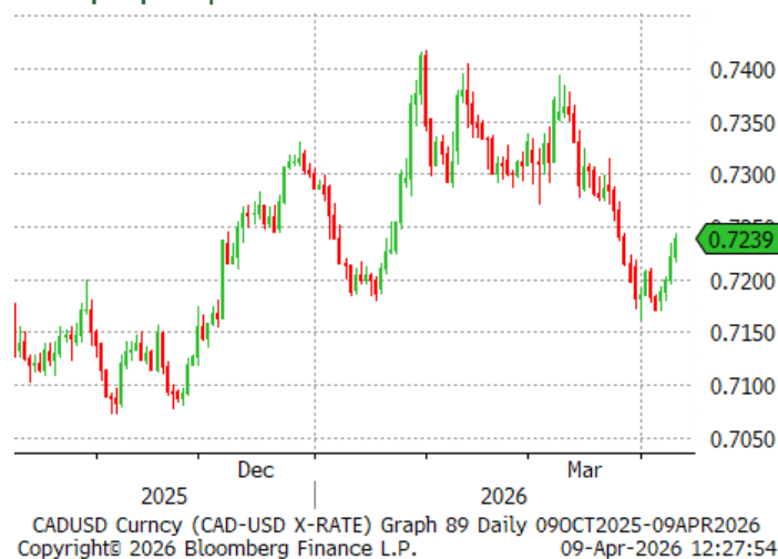
→ Graphique 2 | USDCAD