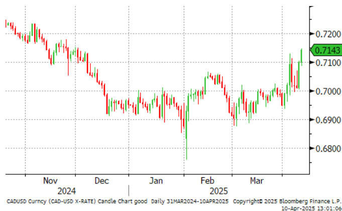
→ Graphique 2 | Prix des grains