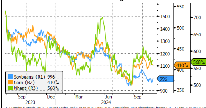
G 1. Prix des grains

S 1 Comdty (Generic 1st 'S' Future) Grains Daily 26JUL2023-31OCT2024 Copyright © 2024 Bloomberg Finance L.P. 31-Oct-2024 08:29:08