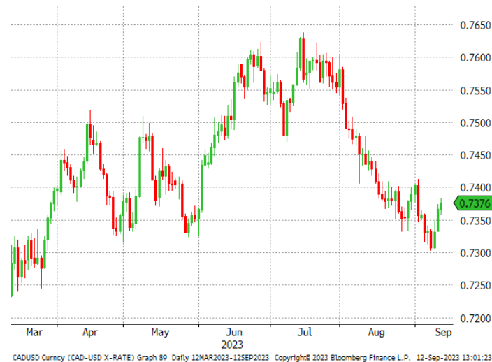
Graphique 2. Taux CADUSD